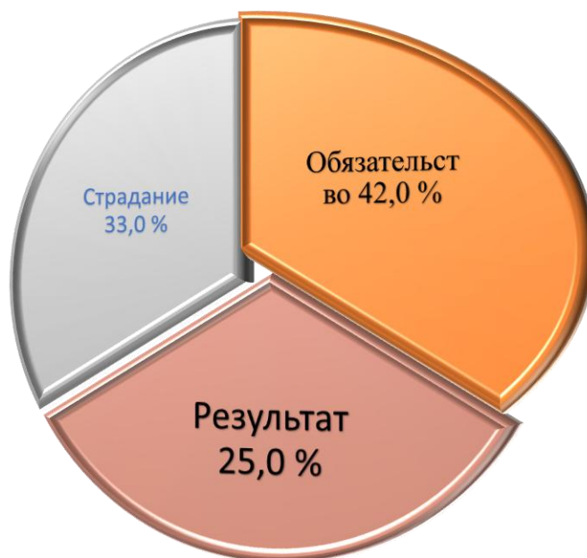
Диаграмма 1. Частотное распределение ассоциативных связей в русском языке

семантический анализ словосочетаний и метафор для выявления устойчивых ассоциаций (например, «труд» связывается с «долгом» и «усталостью», «мехнат» – с «шараф» (честь) и «ризқи ҳалол» (честный заработок)). На третьем этапе проводилось группирование лексических единиц с последующим определением их относительной частоты. Данный подход позволил получить обобщённые данные о концептуальных структурах: было проанализировано около 1200 контекстов для русского слова «труд» (более 95 000 употреблений) и 950 контекстов для таджикского слова «мехнат» (более 18 000 употреблений). Распределение слов по жанрам выявило различия в их использовании: «труд» чаще всего встречался в русской художественной литературе (47 %), журналистике (32 %) и научных текстах (21 %), а «мехнат» – в таджикской художественной литературе (52 %), журналистике (28 %) и научных или официальных текстах (20 %). Результаты были представлены в виде диаграмм.